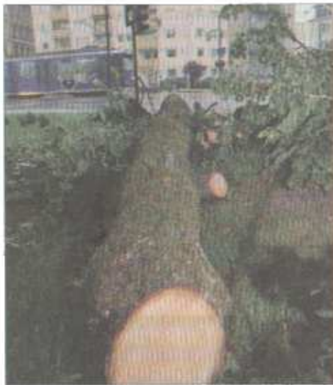
Gefahr beseitigt: Äste dieses Baumes hingen auf die Oberleitung am Theodor-Heuss-Platz – deshalb wurde er gefällt.

(jöh/bo). Chaos im Straßenbahn-Verkehr: Rund eine Dreiviertelstunde lang waren gestern Mittag die Linien 3 und 4 lahm gelegt. Hunderte mussten deshalb auf andere Verkehrsmittel ausweichen oder warten. Der Auslöser: Die Äste eines Baumes hingen auf der Wendeschleife der Tram am Theodor-Heuss-Platz in die Oberleitung. Damit die Feuerwehr den Baum fällen konnte, wurde der Strom abgeschaltet.